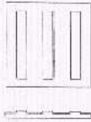
Figura 2: Baldosa guía